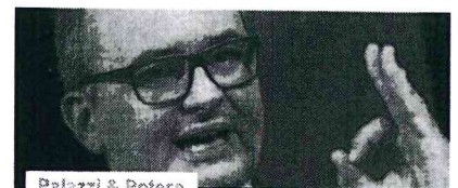
Palazzi & Potere

"Verdini in maggioranza attraverso Scelta civica" Zanetti tenta il golpe ma il partito sbatte fuori lui